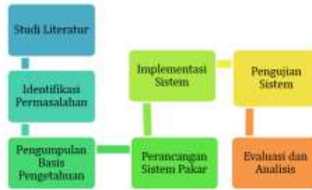
Gambar 1 Alur Tahapan penelitian